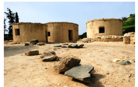
Οικισμός στη Χοιροκοιτία