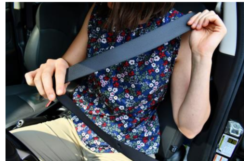
Καθόμαστε στο πίσω κάθισμα και φοράμε τη ζώνη μας

Όταν οδηγούμε ποδήλατο, σταματάμε στο κόκκινο φανάρι και περνάμε στο πράσινο.