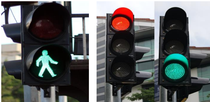
Περνάμε τον δρόμο, όταν το φανάρι των πεζών είναι πράσινο

Όταν οδηγούμε ποδήλατο, σταματάμε στο κόκκινο φανάρι και περνάμε στο πράσινο.