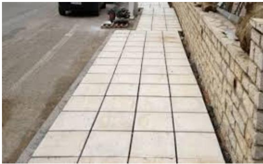
Περπατάμε στο πεζοδρόμιο

Ο Σωτήρης διάβασε τον Κώδικα Οδικής Κυκλοφορίας κι έμαθε κανόνες για το πώς κυκλοφορούμε σωστά :