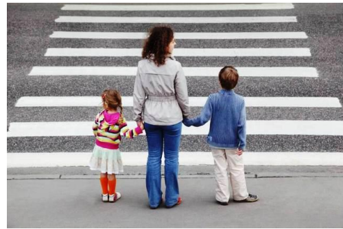
Περνάμε τον δρόμο από τις διαβάσεις