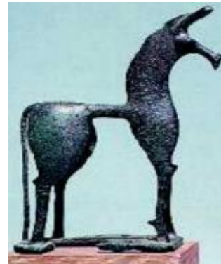
Έφτιαχναν μικρά αγάλματα από ξύλο ή μέταλλο.