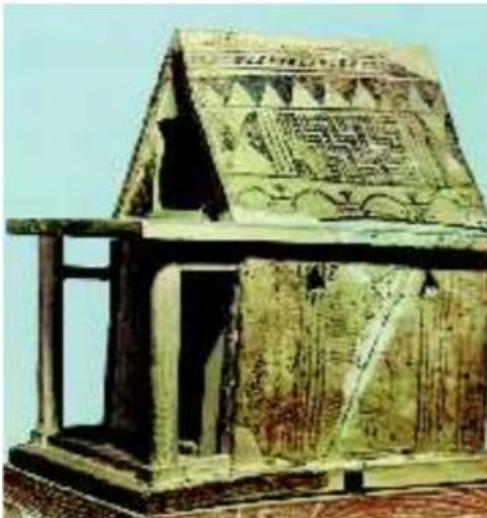
Τα σπήια των ανθρώπων ήταν μικρά και από πέτρα.