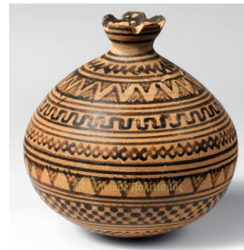
Τα αγγεία είχαν σχεδιασμένα πάνω τους διάφορα γεωμετρικά σχήματα.