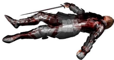
Ο Κωνσταντίνος Παλαιολόγος πέθανε στη μάχη.