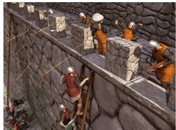
Οι Τούρκοι σκαρφάλωσαν στα τείχη για να μπουν μέσα στην Πόλη.