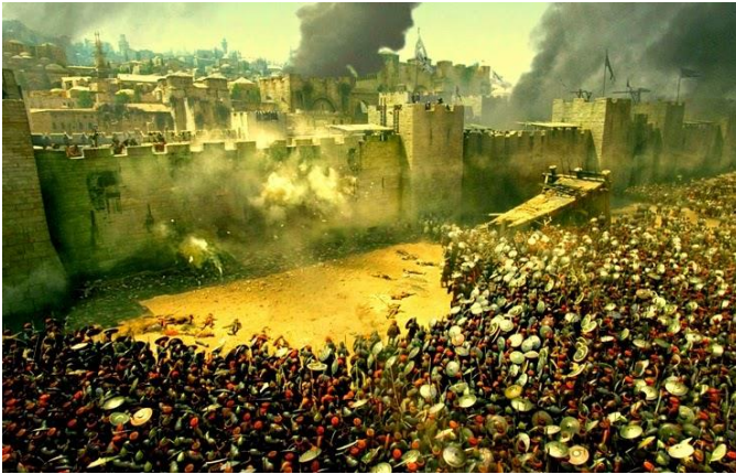
Οι Οθωμανοί Τούρκοι περικύκλωσαν την Πόλη.