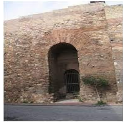
Οι Τούρκοι μπήκαν στην Πόλη από μια μικρή πόρτα, την Κερκόπορτα.