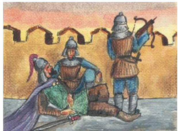
Ο Ιωάννης Ιουστινιάνης τραυματίστηκε.