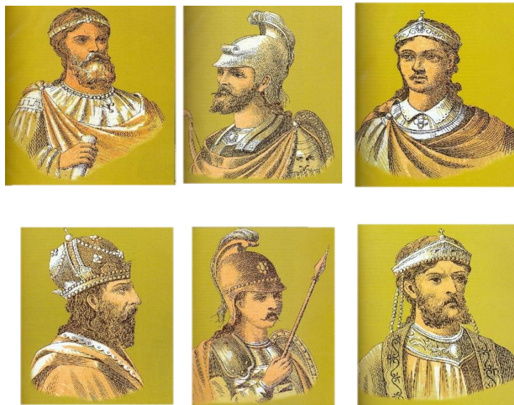
Οι Μακεδόνες αυτοκράτορες