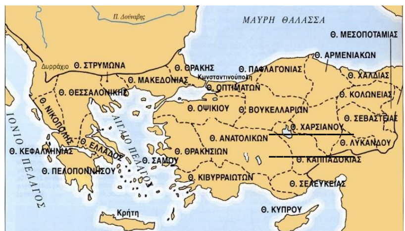
Ο Λέων Γ' ο Ίσαυρος χώρισε το Βυζάντιο σε μεγάλα κομμάτια, τα θέματα.