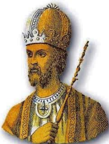
Ο Λέων Γ' ο Ίσαυρος έλυσε τα προβλήματα του Βυζαντίου

Έτσι, τα μεγάλα προβλήματα του Βυζαντίου λύθηκαν .