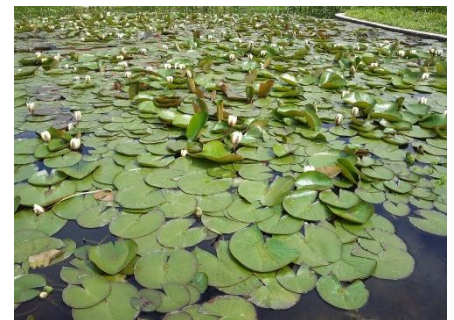
Κοντά στις λίμνες υπάρχουν πολλά νούφαρα .