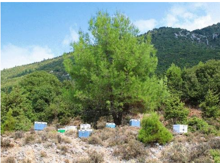
Στα βουνά βλέπουμε πεύκα , έλατα κ.α.

Υπάρχουν φυτά που ζουν σε πεδιάδες και φυτά που ζουν σε βουνά , φυτά που ζουν κοντά σε θάλασσες , λίμνες και ποτάμια .