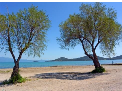
Στις θάλασσες συναντάμε αλμυρίκια .