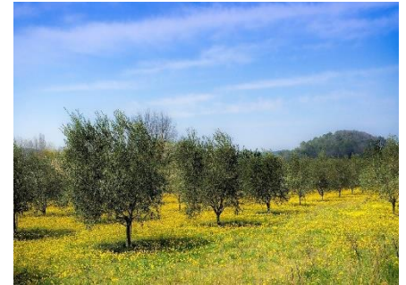
Στις πεδιάδες φυτρώνουν πολλές ελιές κ.α.