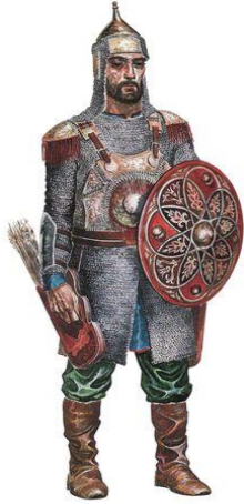
Οι Βούλγαροι έμεναν στα Βαλκάνια