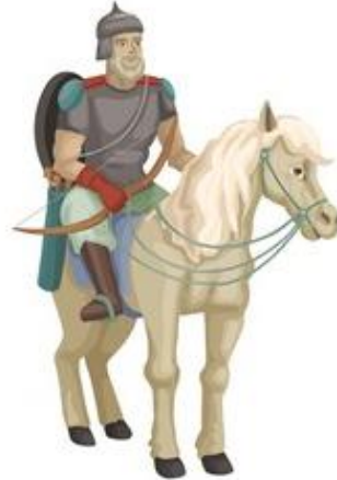
Οι Ρώσοι έμεναν στην Ανατολική Ευρώπη