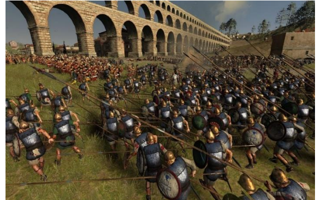
Οι Βούλγαροι και οι Ρώσοι επιτέθηκαν στην Κωνσταντινούπολη. Οι Βυζαντινοί όμως τους νίκησαν.