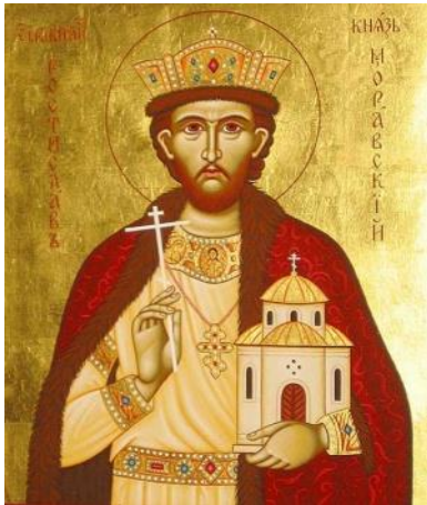
Ο Ρατισλάβος ήταν αρχηγός των Σλάβων