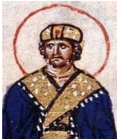
Ο Μιχαήλ ο Γ' ήταν αυτοκράτορας των Βυζαντινών