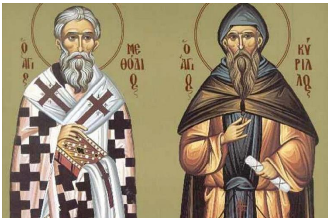
Ο Κύριλλος κι ο Μεθόδιος έκαναν τους Σλάβους Χριστιανούς και τους έδωσαν το σλαβικό αλφάβητο