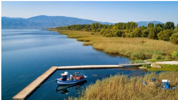
Η λίμνη Τριχωνίδα