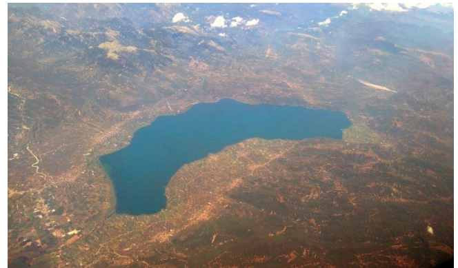
Η λίμνη Τριχωνίδα από ψηλά

Στις λίμνες ζουν φυτά (χλωρίδα) και πολλά ζώα (πανίδα), όπως πουλιά, ψάρια κι ερπετά.