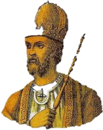
Ο Λέων Γ' ο Ίσαυρος έγινε αυτοκράτορας του Βυζαντίου