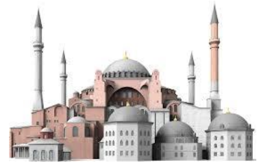
Οι Άραβες επιτέθηκαν 2 φορές στην Κωνσταντινούπολη