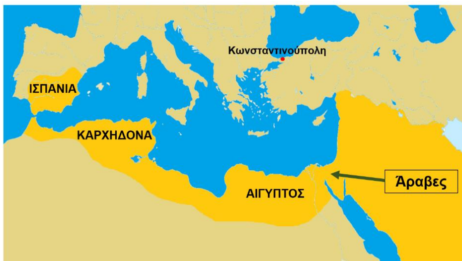
Οι Άραβες κατέκτησαν την Αίγυπτο, την Καρχηδόνα και την Ισπανία.