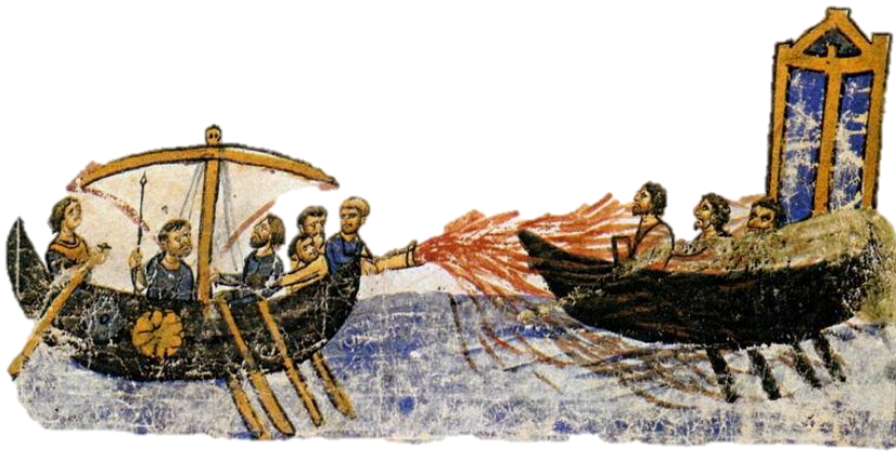
Οι Βυζαντινοί έριξαν το υγρό πυρ στους Άραβες, έκαψαν πολλά πλοία και τους νίκησαν.