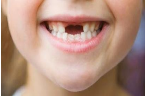
Δόντια παιδιού, νεογιλά