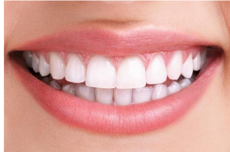
Δόντια μεγάλου, μόνιμα

☞ Μετά το φαγητό, πρέπει να βουρτσίζουμε πολύ καλά τα δόντια μας!