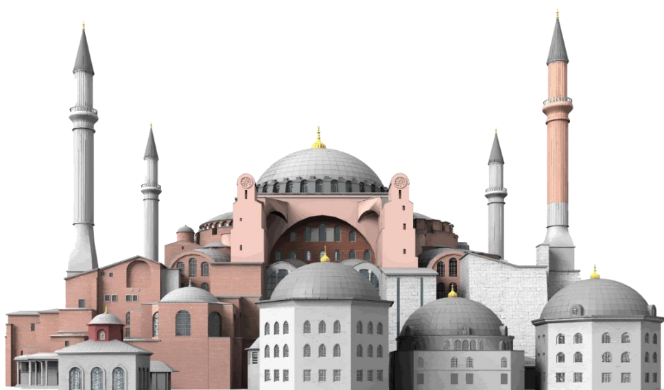
Η Αγία Σοφία, 537 μ.Χ.

Η εκκλησία της Αγίας Σοφίας ήταν η καλύτερη στον κόσμο. Πολλοί άνθρωποι και πήγαιναν εκεί για να προσευχηθούν.