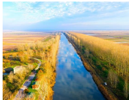
Ο Λουδίας κυλάει στην πεδιάδα της Θεσσαλονίκης

👉 Η δεύτερη μεγαλύτερη πεδιάδα είναι η Θεσσαλική . Εκεί, κυλάει ο Πηνειός ποταμός.