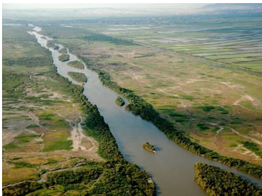
Ο Αξιός κυλάει στην πεδιάδα της Θεσσαλονίκης

Στην πεδιάδα της Θεσσαλονίκης κυλάνε 4 ποταμοί: ο Αξιός, ο Αλιάκμονας, ο Λουδίας κι ο Γαλλικός.