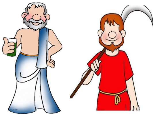
Ο Ιουστινιανός είπε στους μεγαλοκτηματίες (πλούσιοι) να μην παίρνουν τα χωράφια των μικροκτηματιών (φτωχοί).