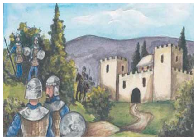
Ο Ιουστινιανός έφτιαξε δυνατό στρατό. Οι στρατιώτες φυλούσαν τα σύνορα του Βυζαντίου.