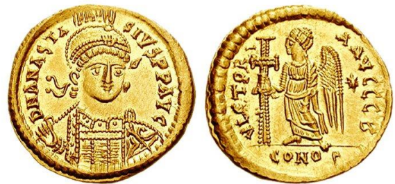
Ο Ιουστινιανός έκοψε χρυσά νομίσματα