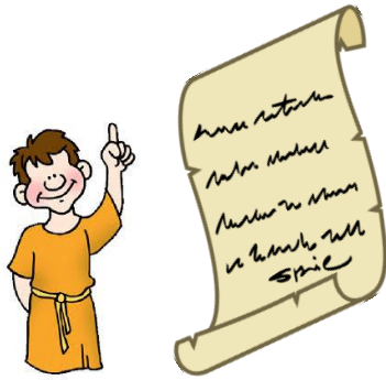
Ο Ιουστινιανός έγραψε νέους νόμους