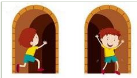
είσοδος - έξοδος

Υπάρχουν πολλές λέξεις που φτιάχνονται με τη λέξη οδός.