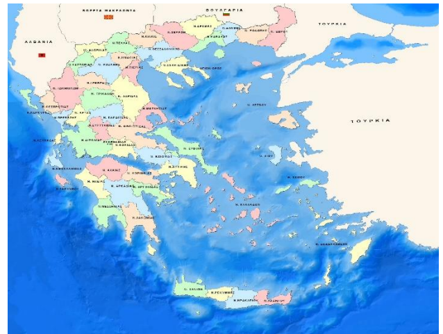
Στον χάρτη βλέπουμε τους νομούς της Ελλάδας.