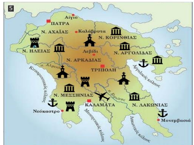
Στον χάρτη βλέπουμε που έχει αεροδρόμια, λιμάνια, εκκλησίες, μουσεία και κάστρα.