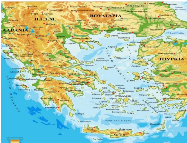
Στον χάρτη βλέπουμε βουνά, πεδιάδες, θάλασσες, ποτάμια και λίμνες.