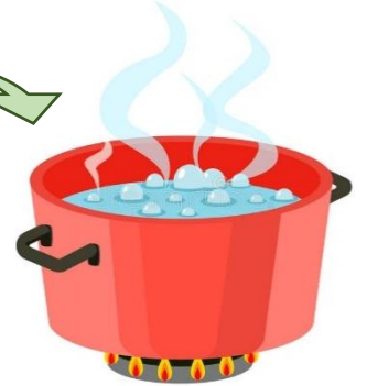
ατμός ( αέριο )