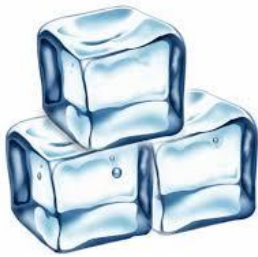
πάγος ( στερεό )