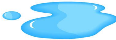
νερό ( υγρό )