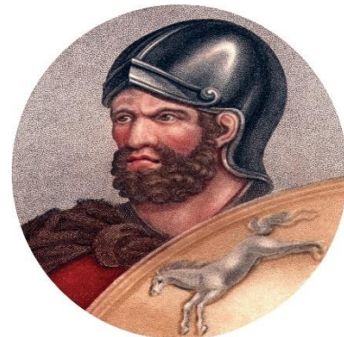
Ο αρχηγός των Καρχηδονίων, ο Αννίβας