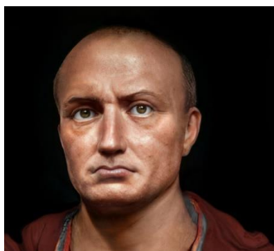
Ο αρχηγός των Ρωμαίων, ο Σκιπίωνας