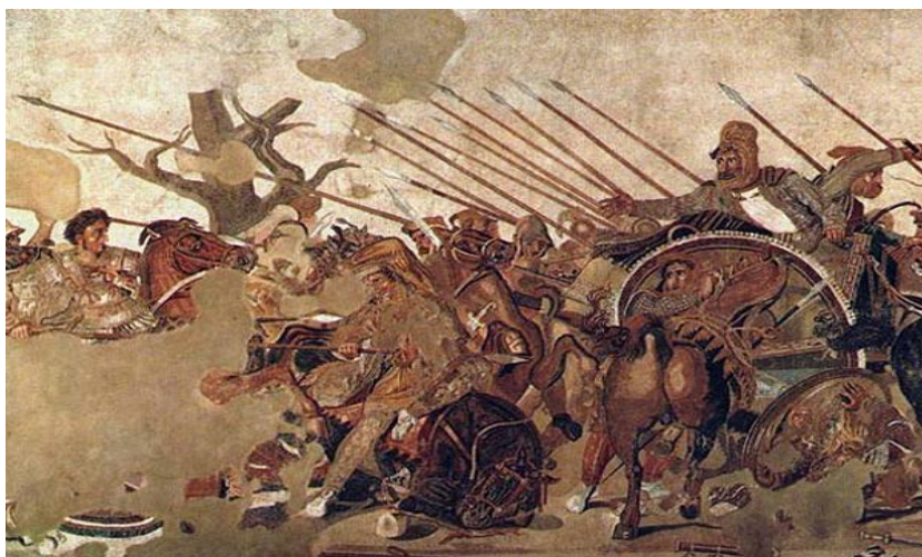
Η μάχη στην Ισσό, το 333 π.Χ.