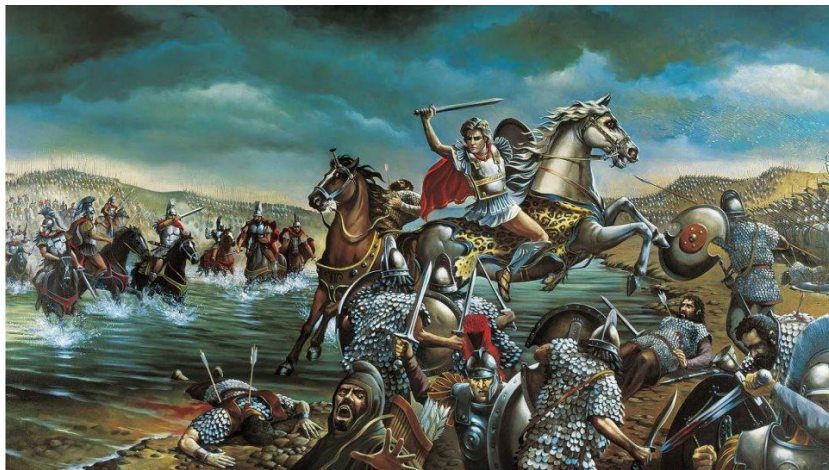
Η μάχη στον Γρανικό ποταμό, το 334 π.Χ.