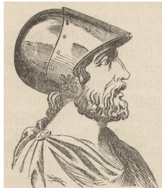
Ο αρχηγός των Θηβαίων, ο Επαμεινώνδας