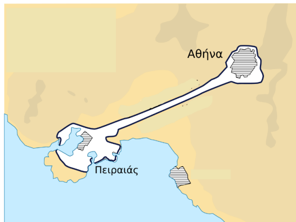
Τα Μακρά τείχη