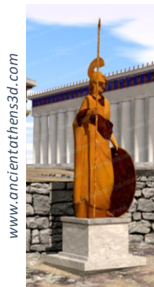
Το χάλκινο άγαλμα της Αθηνάς