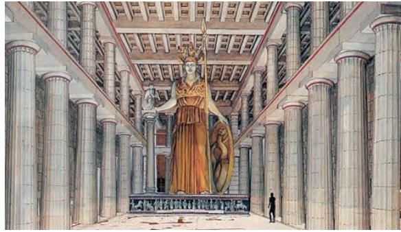
Το χρυσελεφάντινο άγαλμα της Αθηνάς