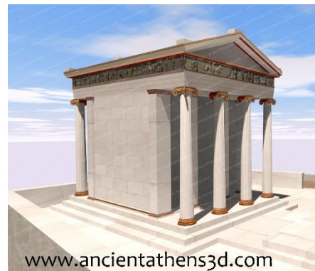
Ο ναός της Αθηνάς Νίκης