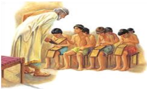
Ο γραμματιστής μάθαινε στα παιδιά ανάγνωση, γραφή και μαθηματικά