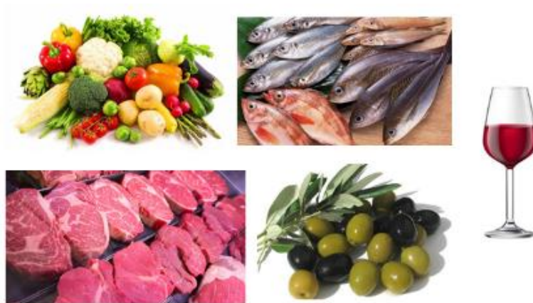
Οι Αθηναίοι έτρωγαν λαχανικά, ελιές, ψάρι, κρέας και έπιναν κρασί