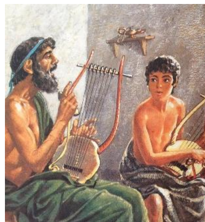
Ο κιθαριστής μάθαινε στα παιδιά μουσική