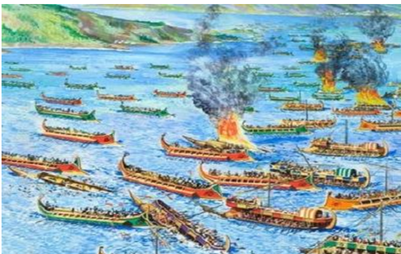
Η ναυμαχία της Μυκάλης