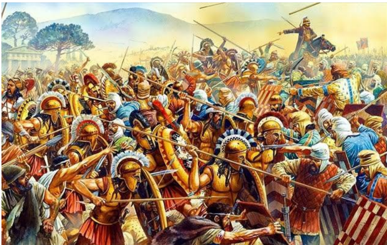
Η μάχη των Πλαταιών