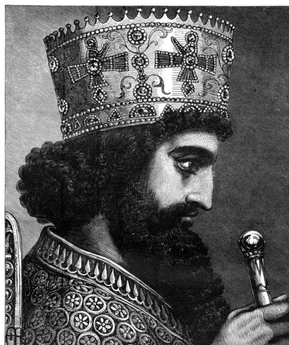
Ο αρχηγός των Περσών, ο Ξέρξης