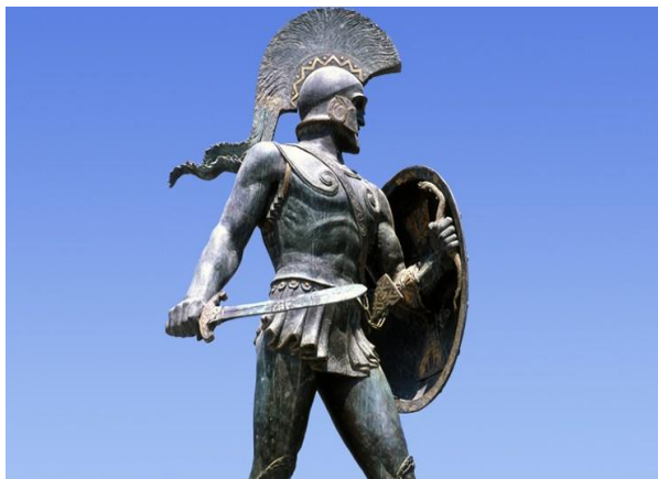
Ο αρχηγός των Ελλήνων, ο Λεωνίδας