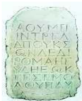
Ο Δράκοντας έγραψε τους νόμους της Αθήνας